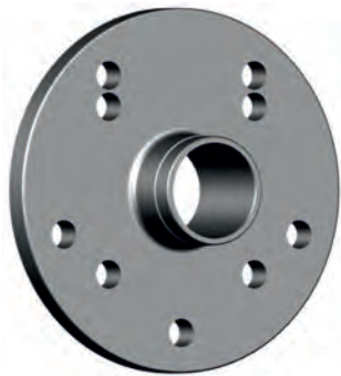
211e201 400 PCD: 4x100/5x120