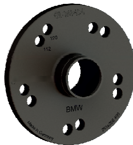
251e208 400 PCD: 5x112/5x120 BMW-#: 8124 2 350 542