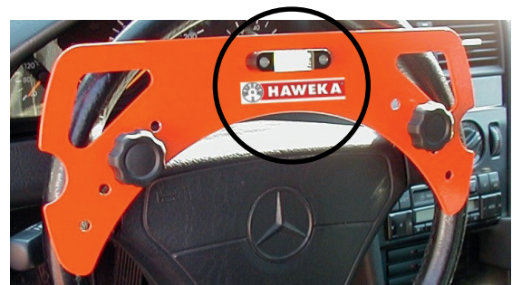
Das Positionieren des Lenkrades erfolgt über eine Libelle in der Mitte der Lenkradwasserwaage.